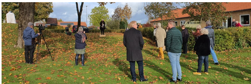
Tale inden afsløring, bemærk det overdækkede kunstværk på den lille bakketop

Skulpturen er nu frit tilgængelig for alle. Så smut ved passende lejlighed forbi Dommerhaven. Kunstværket er smukt placeret på den lille bakketop, som tidligere var flittigt benyttet som kællebakke af børnene i Børnehaven Tinggården. Efter at børnehaven flyttede til Ny Tønningvej 1, kom bakken til at være en del af Dommerhaven. Bakken må fortsat gerne benyttes som kællebakke og legeområde mv., og skulpturen Munin må meget gerne berøres. Den er solidt plantet på bakketoppen, og vil ikke tage skade af, at blive klappet og aet og indgå i leg. Horsens Kommune har som del af projektet opstillet en bæk ved hjertestien ud for den lille bakke, så man kan sidde her og beundre Munin og samtidig har et kig ned mod Tinghuset, hvor Hugin er på bænken ved Tinghusets hovedindgang. På stien, der fører fra Tinghuset ind i Dommerhaven, er der, også i forbindelse med projektet, opstillet et informationsskilt om Dommerhaven og de to skulpturer Hugin og Munin.